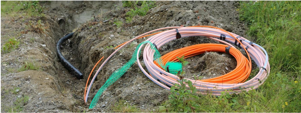
Slangar som används för att blåsa in fiber i.

Det sammanlagda bokförda värdet av inbetalda ägarinsatser i TBN som betalats in av nya medlemmar uppgår vid årets slut till 26,36 miljoner kronor. En ökning från föregående år med 2,37 miljoner kronor.