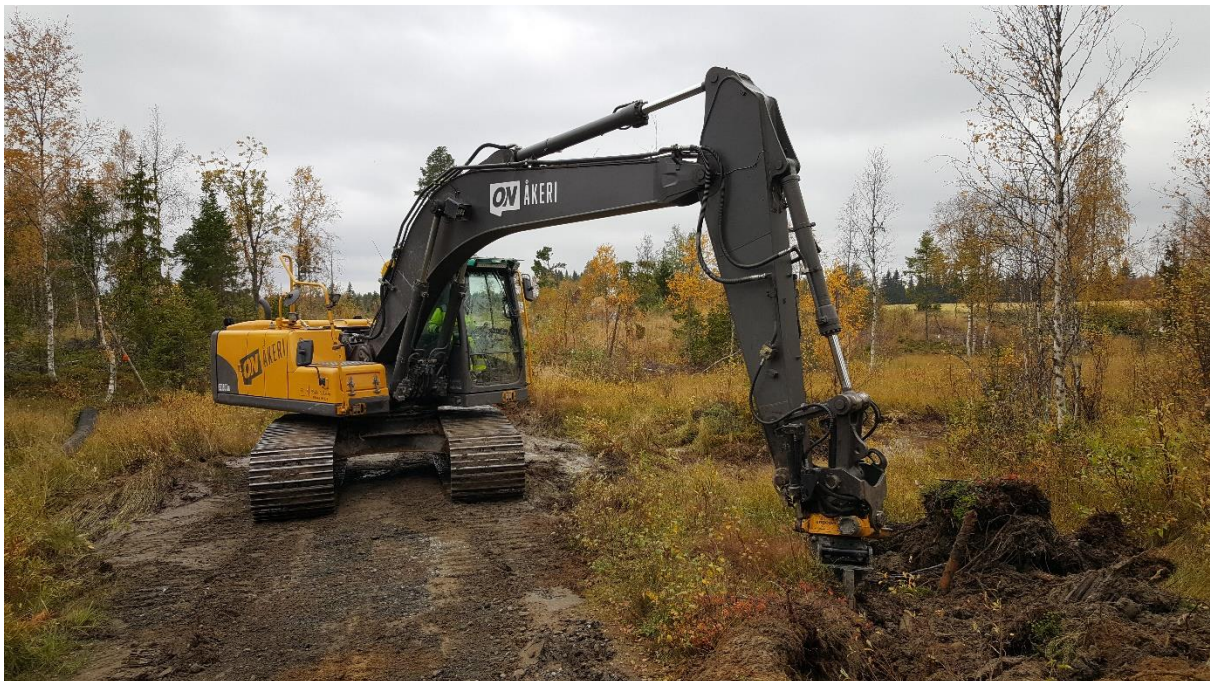
Plöjning av fiber mellan Selet och Jämtland.