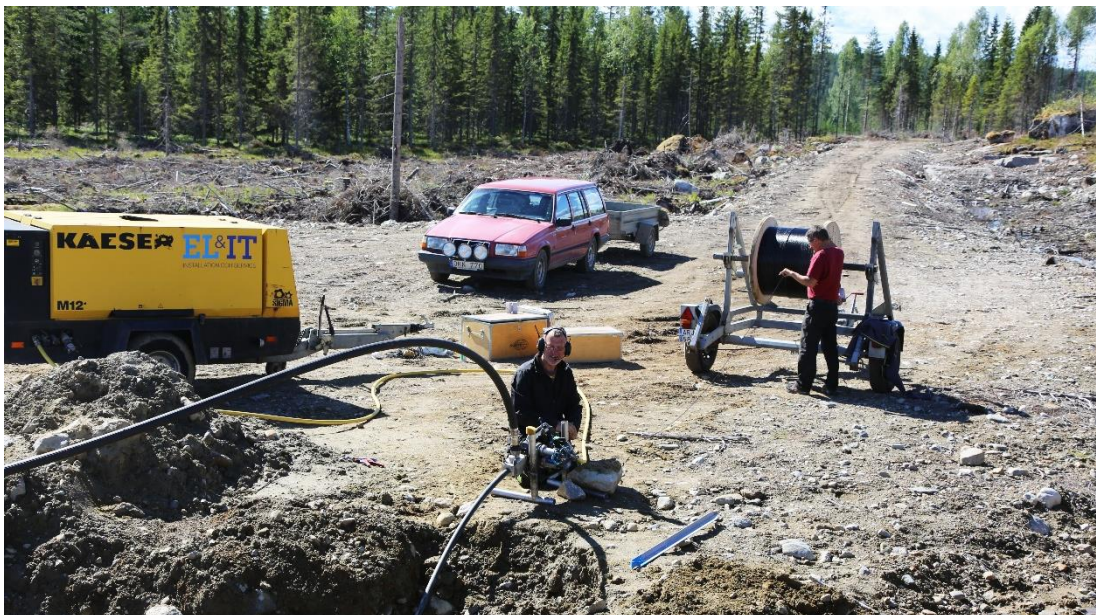
Blåsning av fiber mitt ute i skogen mellan Rödålund och Sunnansjönäs.

Nuvarande avtal omfattar internetleverans och e-post. Utöver det kan var och en teckna enskilda avtal tjänster med olika operatörer, till exempel bredbandstelefontjänst eller strömmande TV.