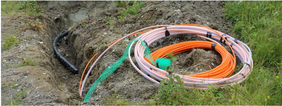
Slangar som används för att blåsa in fiber i.

Det sammanlagda bokförda värdet av inbetalda ägarinsatser i TBN som betalats in av nya medlemmar uppgår vid årets slut till 26,36 miljoner kronor. En ökning från föregående år med 2,37 miljoner kronor.