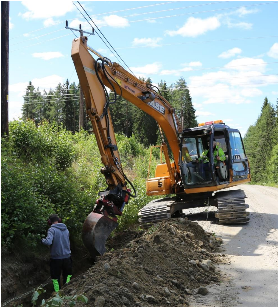
Omförläggning av fiberkabel av mellan Snålltjärn och Tvååbäck.

Alla samtal, åtgärder, beställningar av e-post med mera förs in i en loggbok. Antal noteringar i loggboken under år 2013 uppgår till cirka 820. Av dessa utgörs 149 av noteringar som har med reparation och underhåll att göra, 143 har med ägarbyten och åtgärder i samband med att nya medlemmar ansluter sig, 128 noteringar gäller begäran om utsättning/kabelanvisning i samband med grävarbeten, 92 noteringar gäller avbrott. 79 noteringar gäller frågor om e-post eller beställning av e-postadresser. 77 noteringar rör felanmälningar där felet visat sig sitta i medlemmens egen utrustning, ofta ett routerproblem. 67 noteringar gäller önskemål om att få IP-adressen frigjord i samband med inkoppling av till exempel en ny router. Resten av noteringarna kan klassas som "övriga".