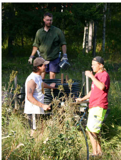
Att dra bredband i samlar ofta såväl gammal och ung. Efter att allt är klart är det ibland en del som tycker det blev lite "tomt" att inte samlas.

medlemmar som ville ansluta sig. De kommunala bidragen stod under de första åren för mindre än 20 procent av kostnaderna. Idag får vi inga bidrag alls när vi skall bygga nya anslutningar.