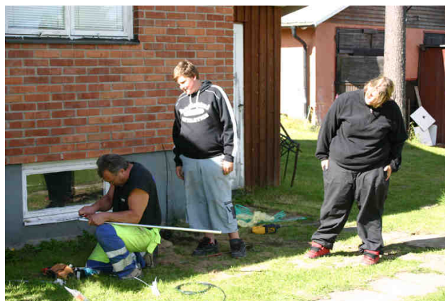
Långfors en härlig dag under år 2004. Snart tänds "ljuset".

För styrelsen var det ett rätt stormigt år. Under hösten fick den signaler från både personer verksam-