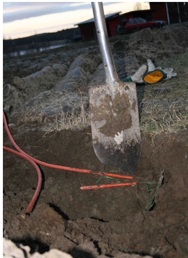
Ibland är det någon som glömmer att begära utsättning när det ska gräva. Det kan bli dyrt!

Utöver de redan planerade byggena inom Etapp II visade det sig att befolkningen i Mickelsträsk med omgivande byar också var intresserade av att ansluta sig till Tavelsjö ByaNät. Och då det vid olika stämmor uttryckts en tydlig vilja att hjälpa andra byar med