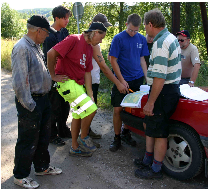
Vilka hus var det nu egentligen som skulle kopplas in? "Snillen spekulerar" under Stärkesmarksprojektet 2006.