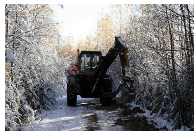
Vackert - men kanske inte det bästa klimatet när man ska få ned en fiber i backen.

Styrelsen har konsekvent haft kravet att varje satsning skall bära sina egna kostnader. En del av de satsningar som gjorts under de tio första åren har berott på att vissa