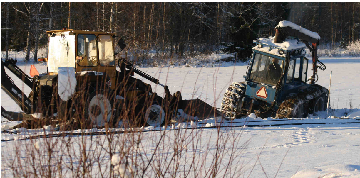
Ibland handlar nedplöjning av fiberkabel mer om kraft än finlir. Tur att det finns resurser i bygden när backen börjat tjäla ihop och ytan täcks av snö.

Vårt nät med utbredning i tre olika kommuner ger oss anledning rikta ett stort tack till de som inom kommunerna medverkat på sitt sätt, olika leverantörer, de företag och alla de som vi haft anledning anlita under dessa tio år. Också ett särskilt tack till föreningens eldsjälur som möjliggjort utbyggnaden så att Tavelstö ByaNät ska fungera på bästa sätt. Ett särskilt