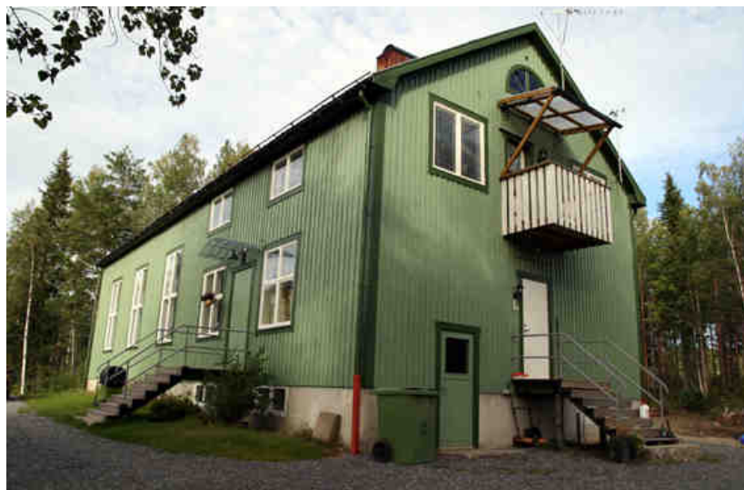
Ett 10-tal bygdegårdar är anslutna till bygdens eget bredband - men utan att betala någon månadsavgift. Allt till nytta för alla bygdens invånare. Detta är Stärkesmarks bygdegård.

Samtidigt som kontrollen av funktionen förbättrades. Nya avtal tecknades med Umeå Energi/ UmeNet och Bredband2.