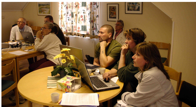
Tavel sjö ByaNät har under åren haft en fungerande - och förhoppningsvis uppskattad - hemsida. Den kommer under år 2012 att ersättas med en ny ”Bygdeportalen.se”. Och då kommer det också att erbjudas utbildningstill-fällen för hågade. Fotot är från Talmansrummet i Tavel sjö bygdegård.

1) Alla i bygden ska kunna bli er-bjudna bredband – även om man har huset utanför någon av de stör-re byarna. Det gör att drift- och underhållskostnader kan bäras av många.