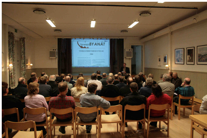
Taveljö ByaNät ekonomisk förening styrs av medlemmarna som tillsammans äger hela fibernätet och bestämmer om vilka som ska vara med i styrelsen. Här handlade det om årsmöte 2007 i Taveljö bygdegård.

Vi vill påminna om att varje aktivt ansluten har tillgång till en