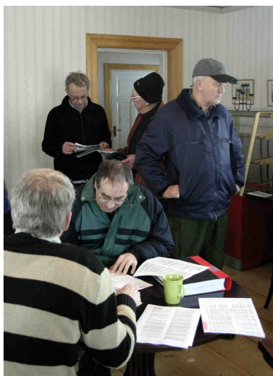
Ibland är det större saker på gång. Här handlade det om utkvittering av nya IP-nummer.

2) Det är bra att det finns hyresfastigheter på landsbygden och dessa ska inte få högre anslutningskostnader än andra.