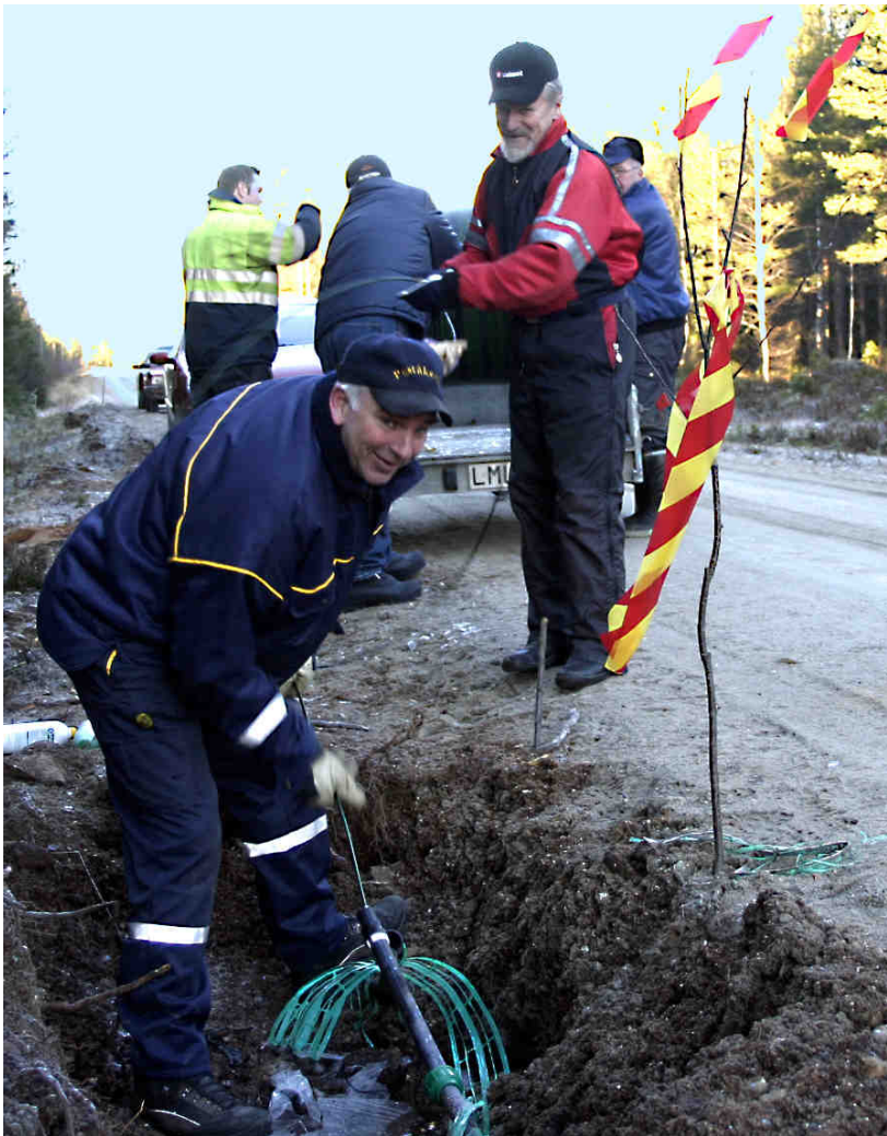
I Mickelsträsk gick "kvinna & man ur huse" för att se till att bredbandet skulle kunna komma till byn. Efter några veckors slit och släp kunde Tectel komma och svetsa ihop tåterna.

hastighet upp till 100Mbit/s utan volymbegränsning. Åtta e-post-adresser med till exempel n.n@tavelsjo.se ingår till varje aktiv anslutning. Dessutom tillgång till maximalt 100 Mbyte utrymme för egen hemsida med adress www.xxxxxx.tavelsjo.se . TV med till exempel SVT:s Play-utbud är tillgängligt via Internet.