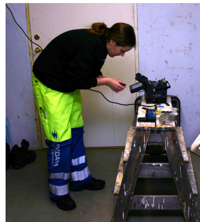
Trollberget nåddes av fiber år 2003. Det är därifrån vi kopplar vidare mot Vindel-Ånaset som anslöts 2010.

Under året inköptes också en så kallad minigrävare. Det innebär att Tavelsjö ByaNät fick tillgång till viktiga grävresurser som kan sättas in med kort varsel. Samtidigt ger det föreningens medlemmar att hyra grävaren till mycket förmånlig kostnad när den inte används för annat.