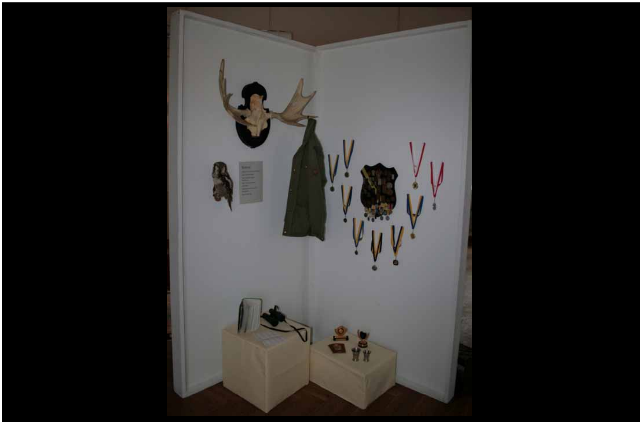
Utställningen "Udda samlingar och mera sansade". Tavelnsjö hembygdsförening april 2007.