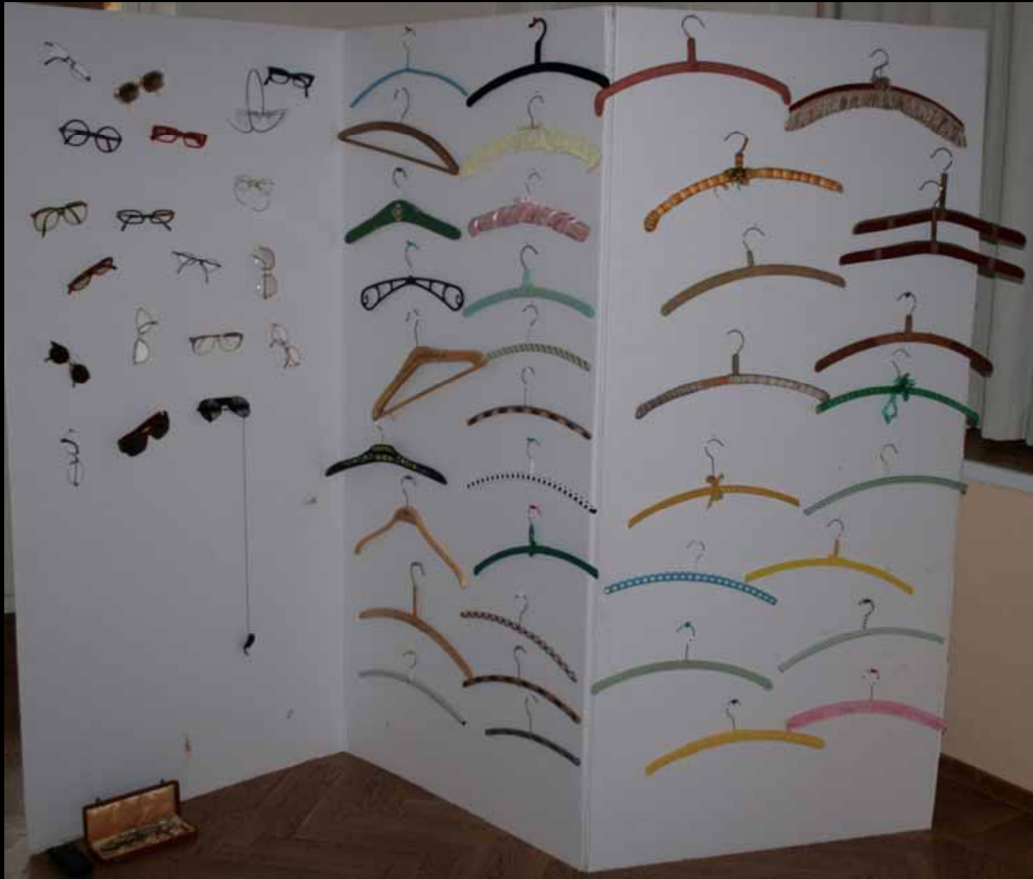
Utställningen "Udda samlingar och mera sansade". Taveljö hembygdsförening april 2007.