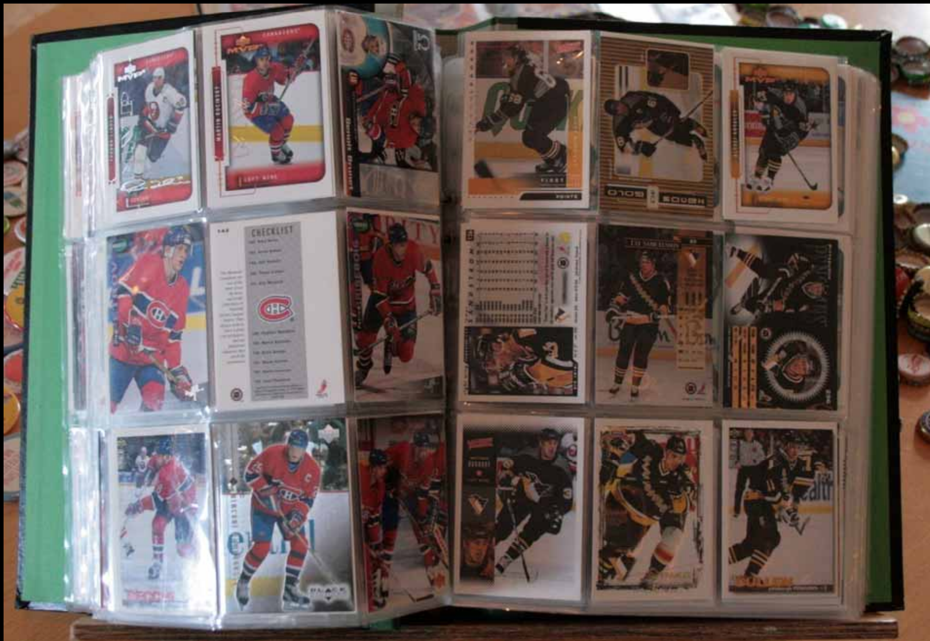
Utställningen "Udda samlingar och mera sansade". Tavelsjö hembygdsförening april 2007.