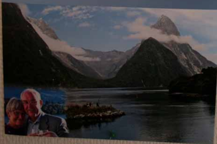
Utställningen "Udda samlingar och mera sansade". Taveljö hembygdsförening april 2007.