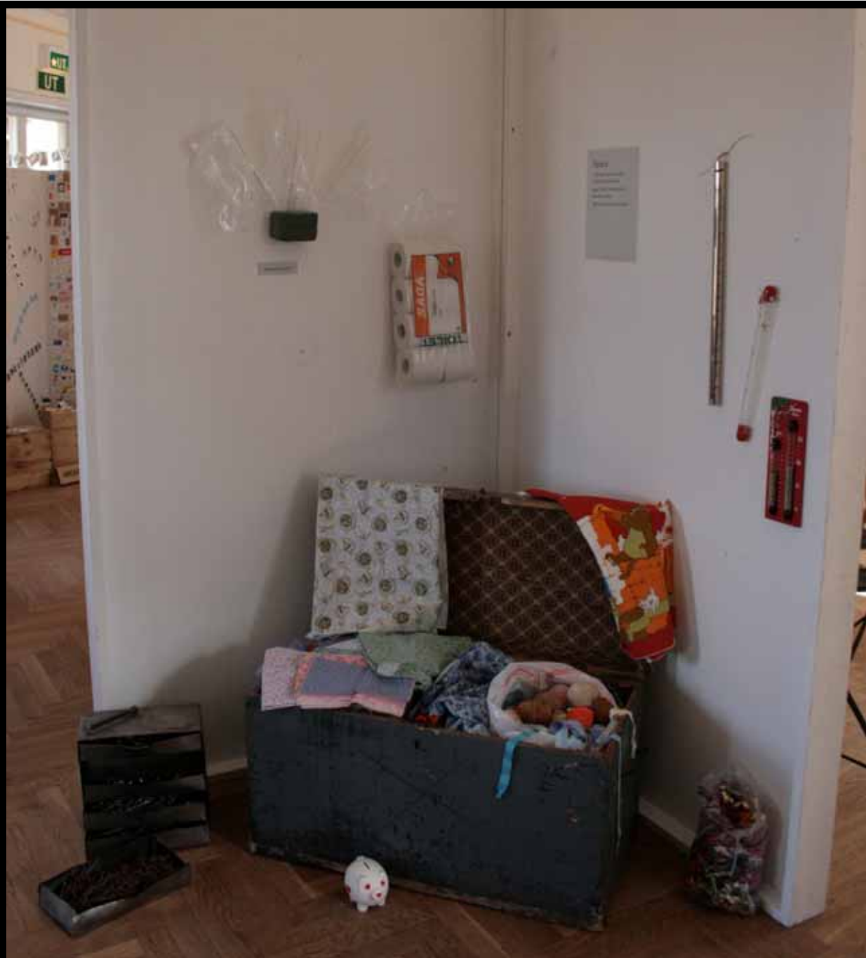
Utställningen "Udda samlingar och mera sansade". Tavelnsjö hembygdsförening april 2007.