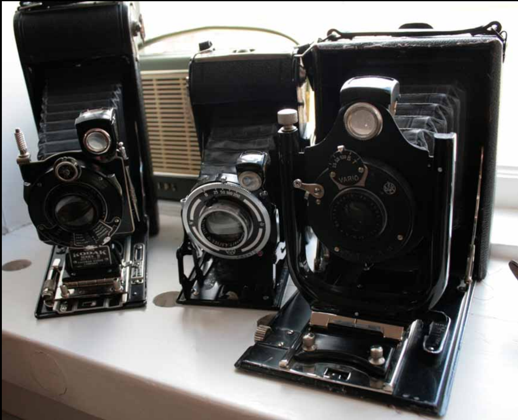
Utställningen "Udda samlingar och mera sansade". Taveljö hembygdsförening april 2007.