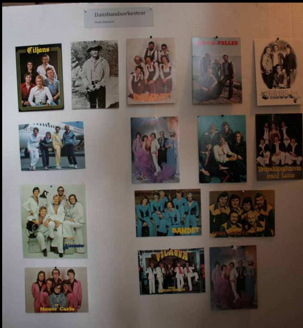
Utställningen "Udda samlingar och mera sansade". Taveljö hembygdsförening april 2007.