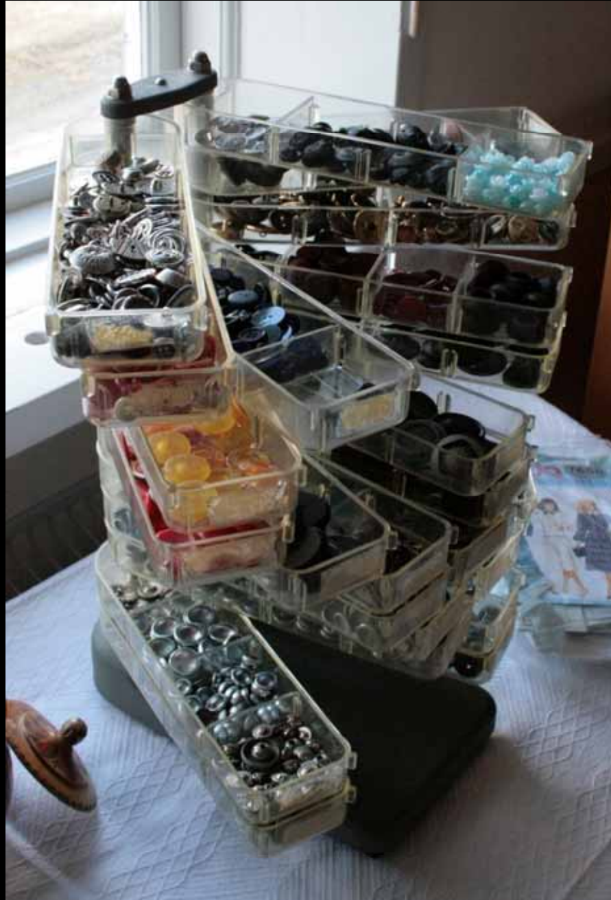
Utställningen "Udda samlingar och mera sansade". Tavelnsjö hembygdsförening april 2007.