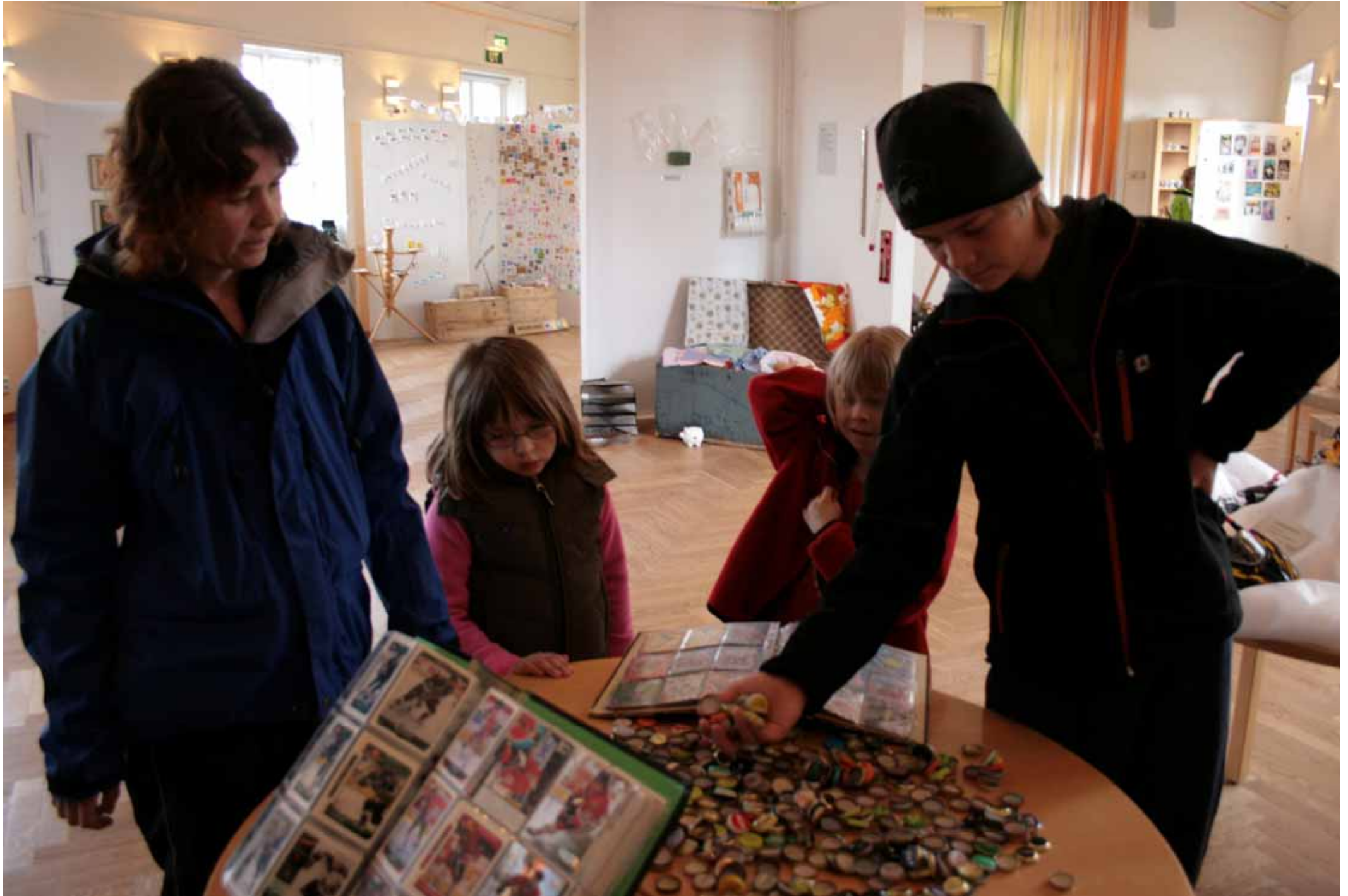
Utställningen "Udda samlingar och mera sansade". Tavelnsjö hembygdsförening april 2007.