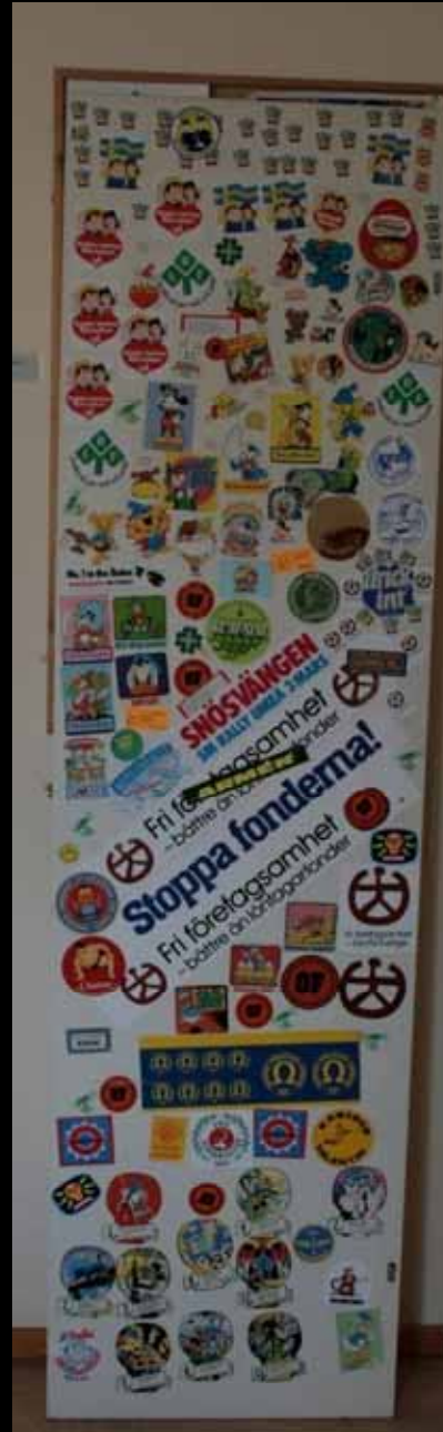
Utställningen "Udda samlingar och mera sansade". Tavelstö hembygdskommitté april 2007.