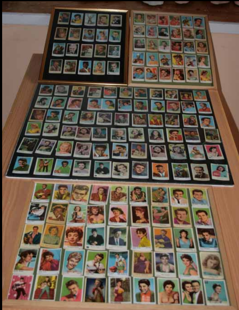
Utställningen "Udda samlingar och mera sansade". Tavelsjö hembygdsförening april 2007.