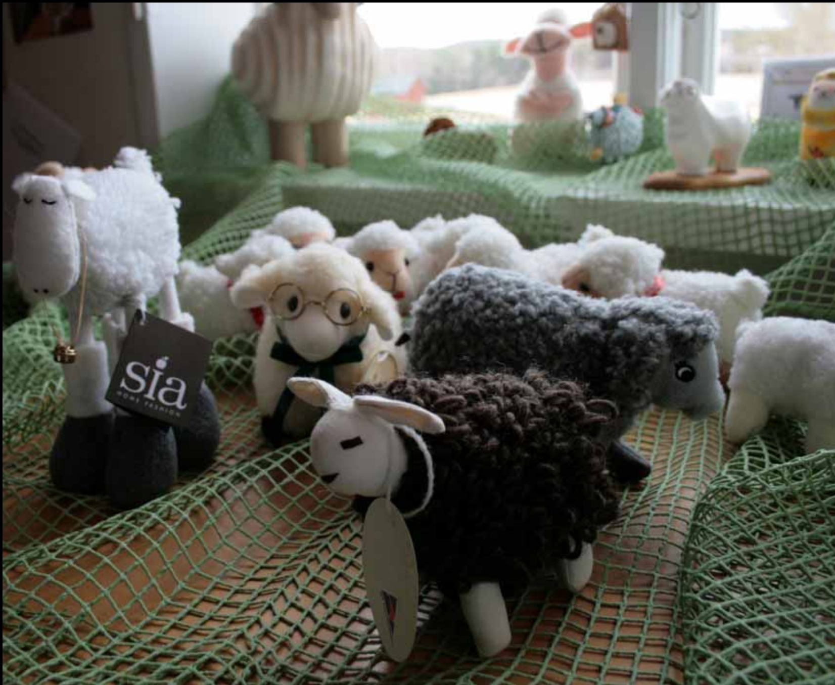
Utställningen "Udda samlingar och mera sansade". Taveljö hembygdsförening april 2007.