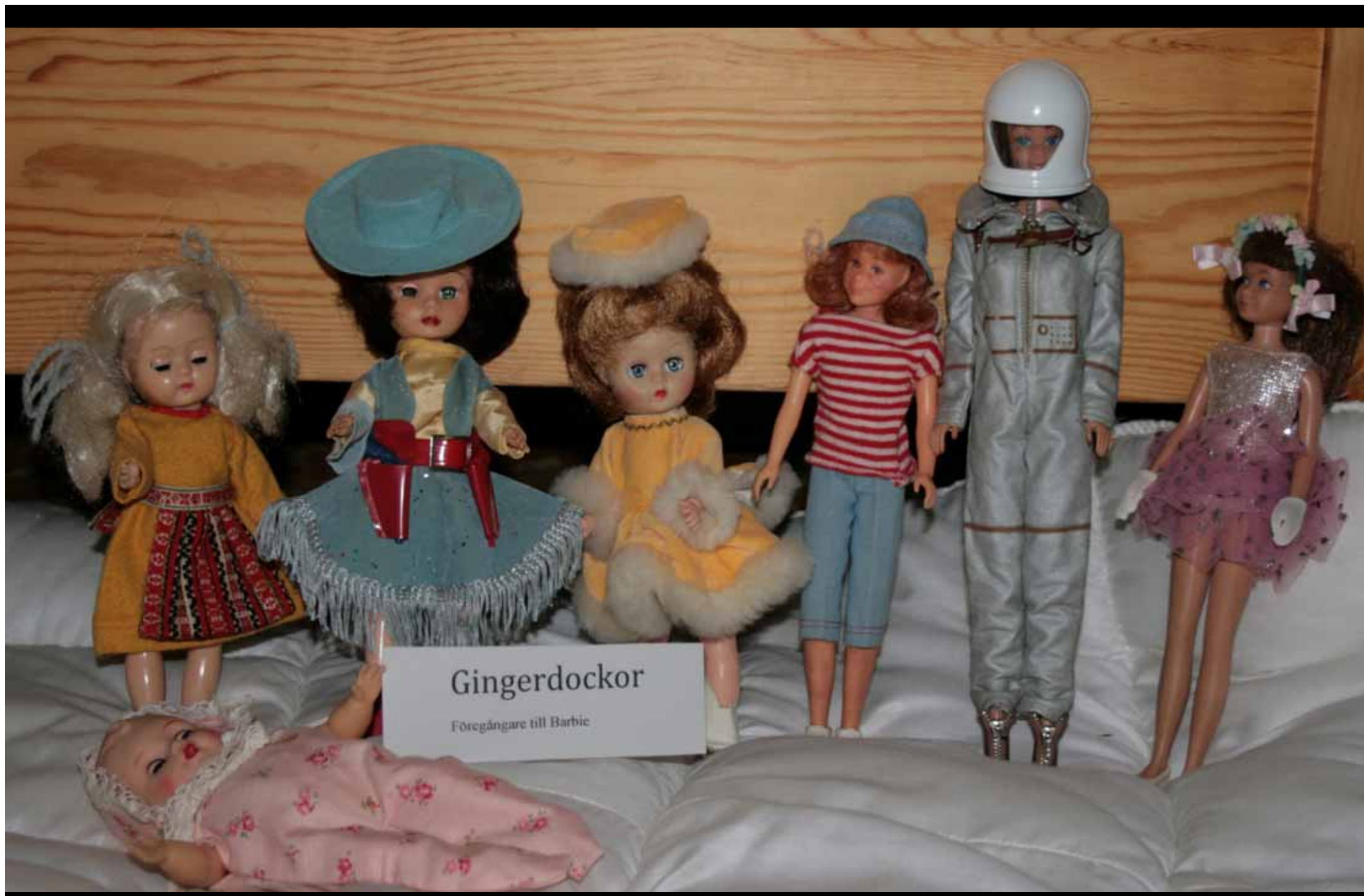
Utställningen "Udda samlingar och mera sansade". Tavelsjö hembygdsförening april 2007.