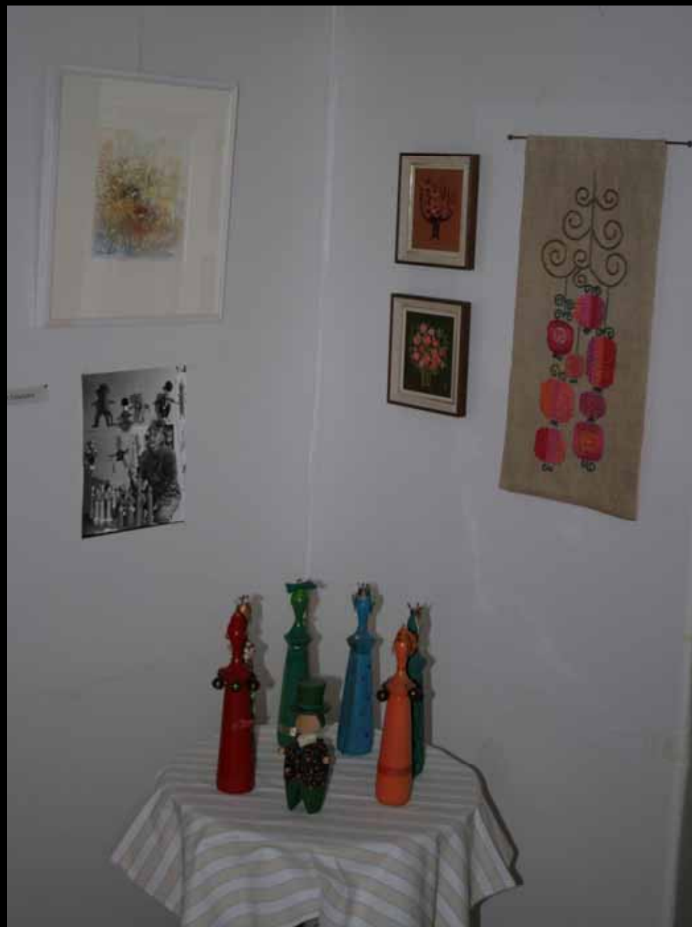
Utställningen "Udda samlingar och mera sansade". Taveljö hembygdsförening april 2007.