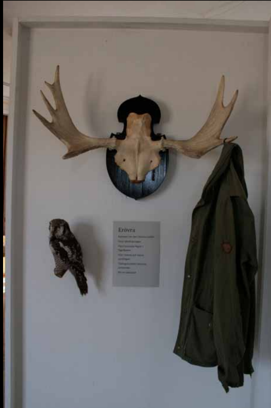
Utställningen "Udda samlingar och mera sansade". Tavelsjö hembygdsförening april 2007.