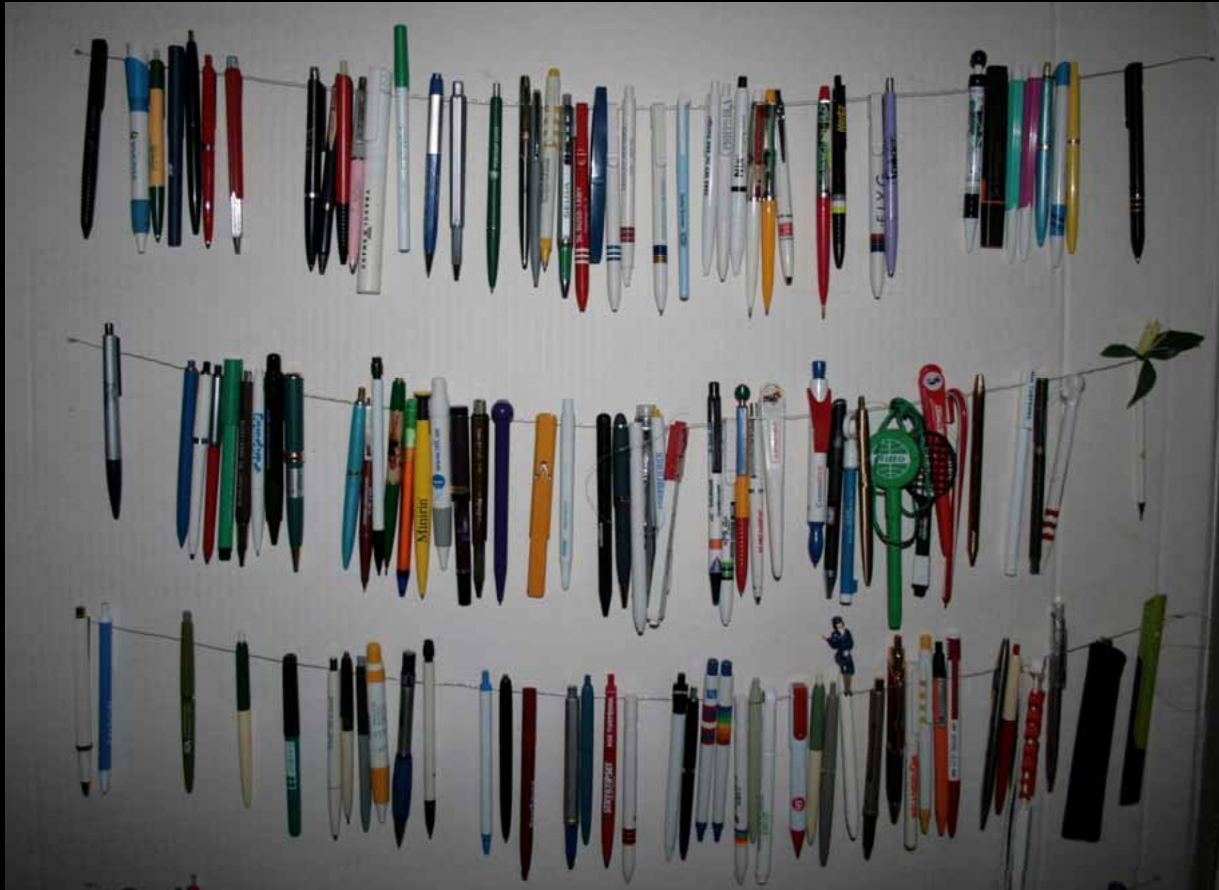
Utställningen "Udda samlingar och mera sansade". Taveljö hembygdskommitté april 2007.