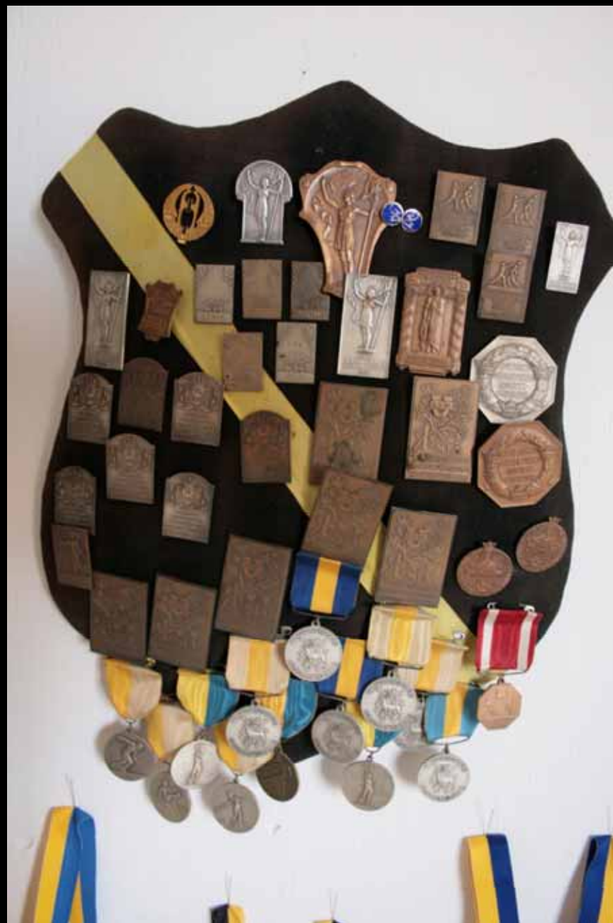
Utställningen "Udda samlingar och mera sansade". Tavelnsjö hembygdsförening april 2007.