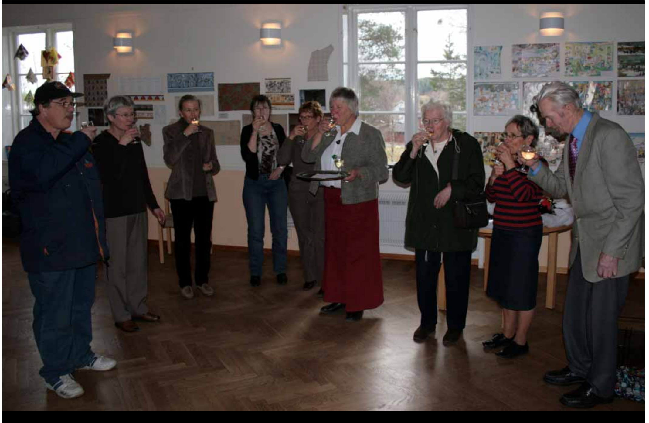
Utställningen "Udda samlingar och mera sansade". Taveljö hembygdsförening april 2007.