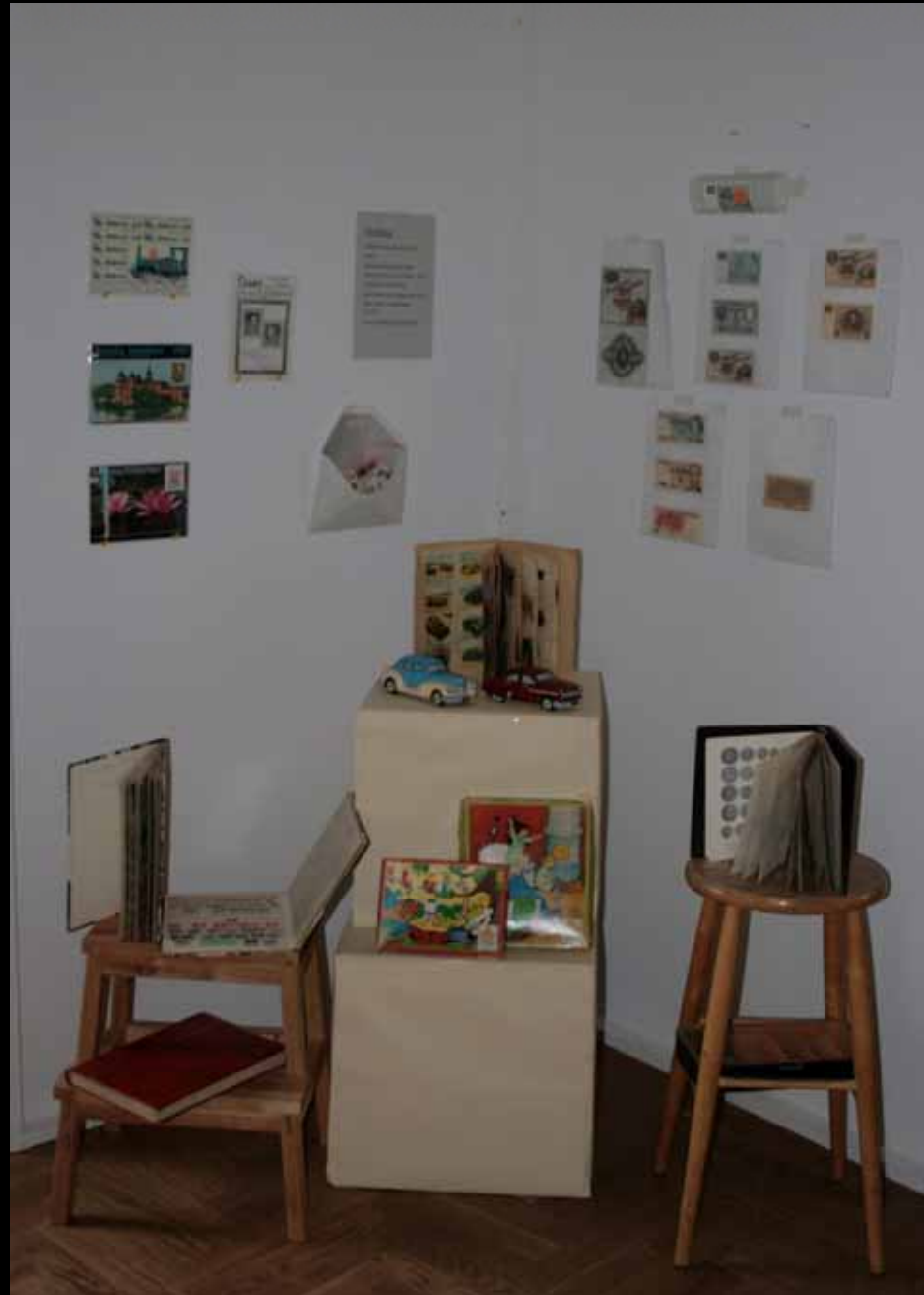
Utställningen "Udda samlingar och mera sansade". Tavelsjö hembygdsförening april 2007.