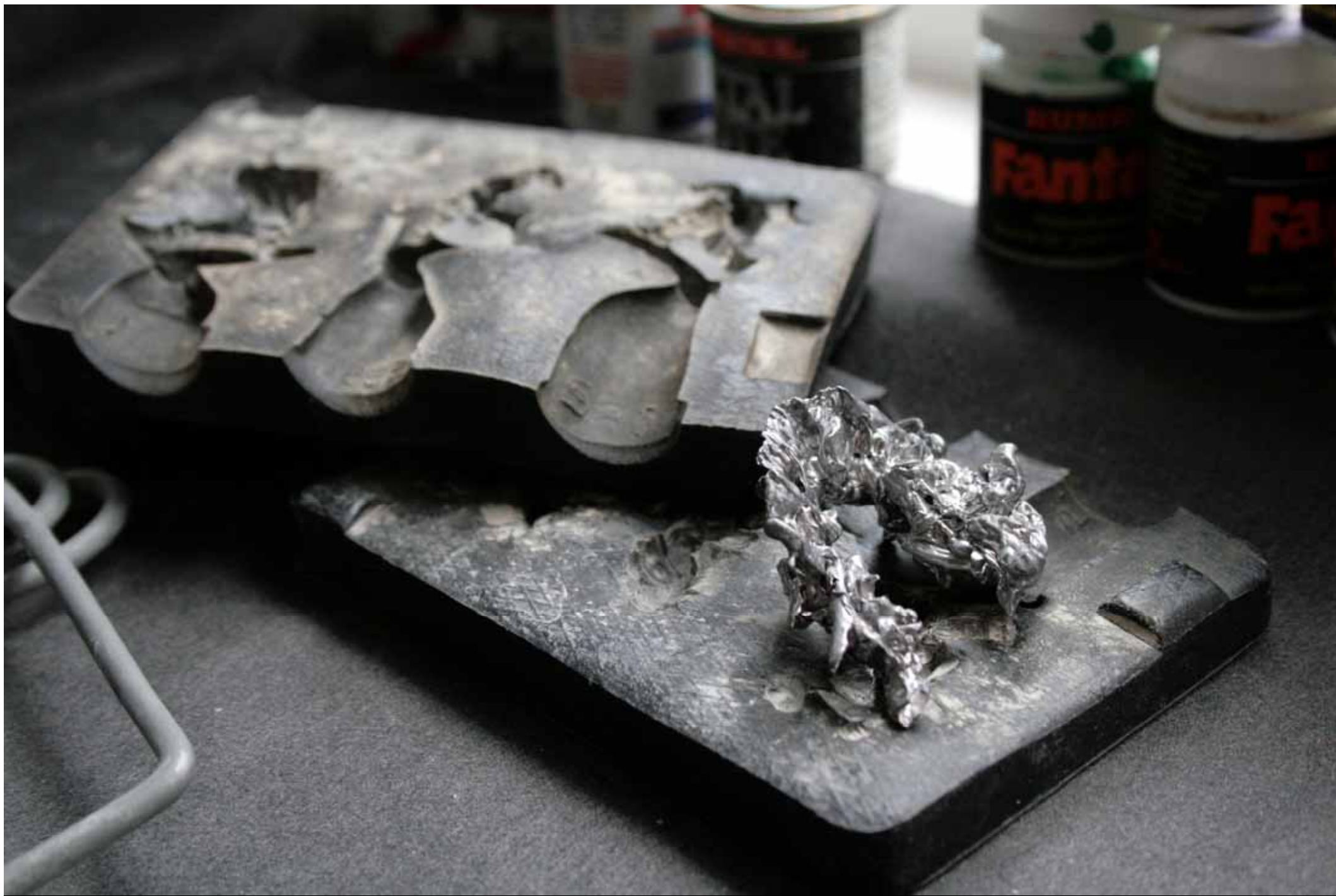
Utställningen "Udda samlingar och mera sansade". Tavelnsjö hembygdsförening april 2007.