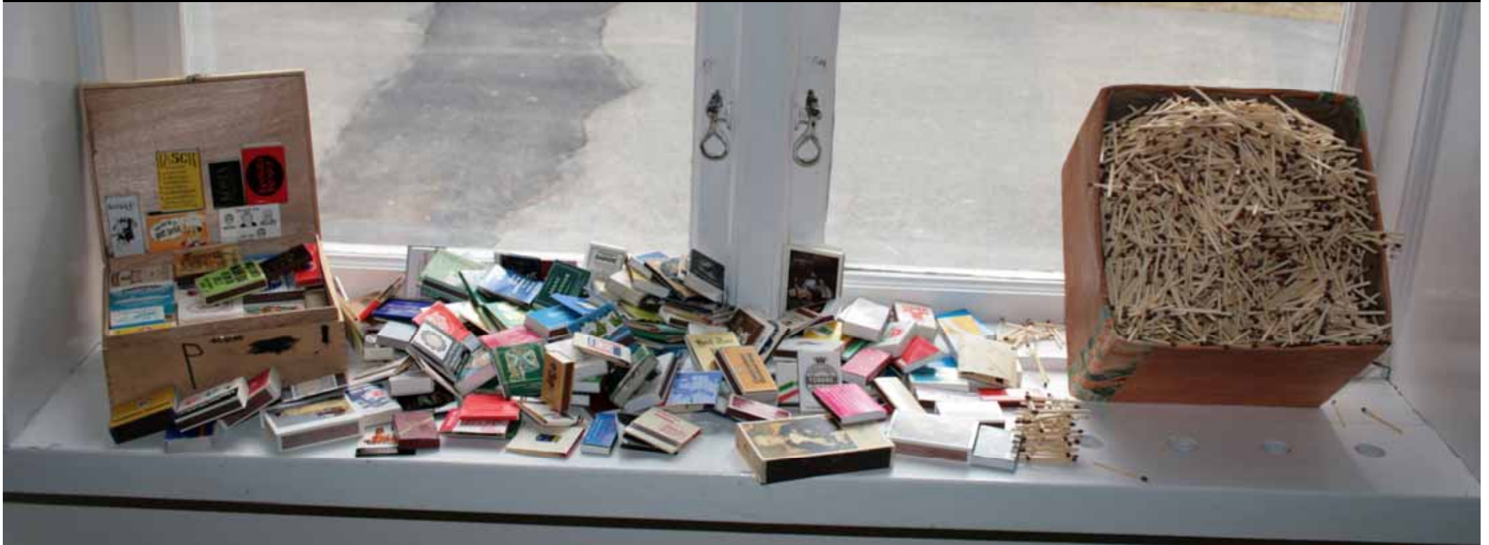
Utställningen "Udda samlingar och mera sansade". Taveljö hembygdsförening april 2007.