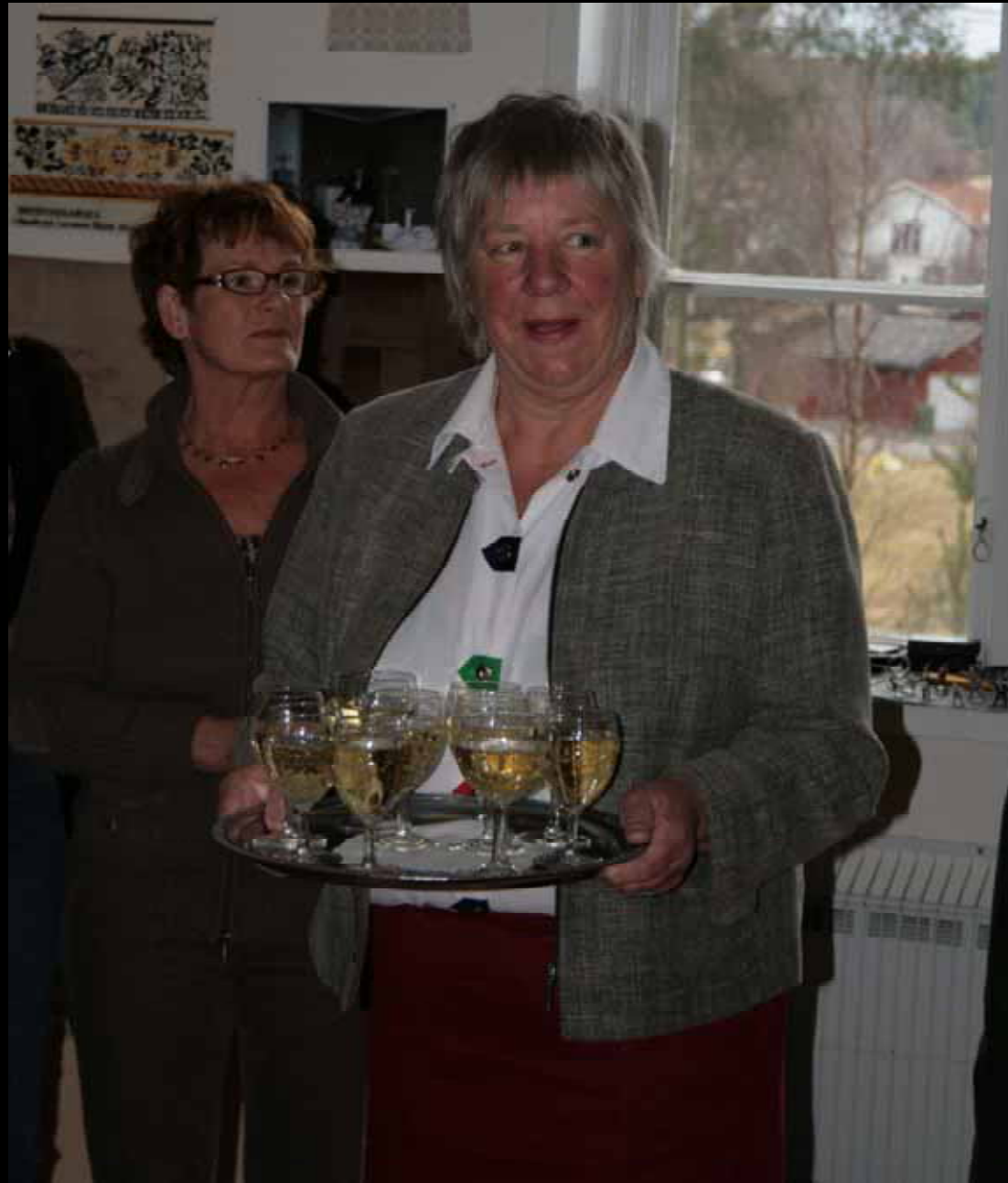
Utställningen "Udda samlingar och mera sansade". Tavelsgö hembygdsförening april 2007.