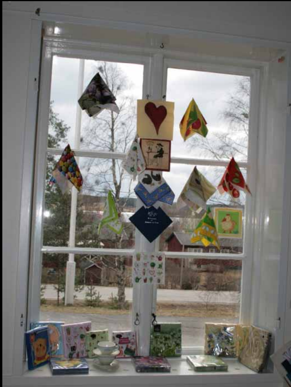
Utställningen "Udda samlingar och mera sansade". Taveljö hembygdsförening april 2007.