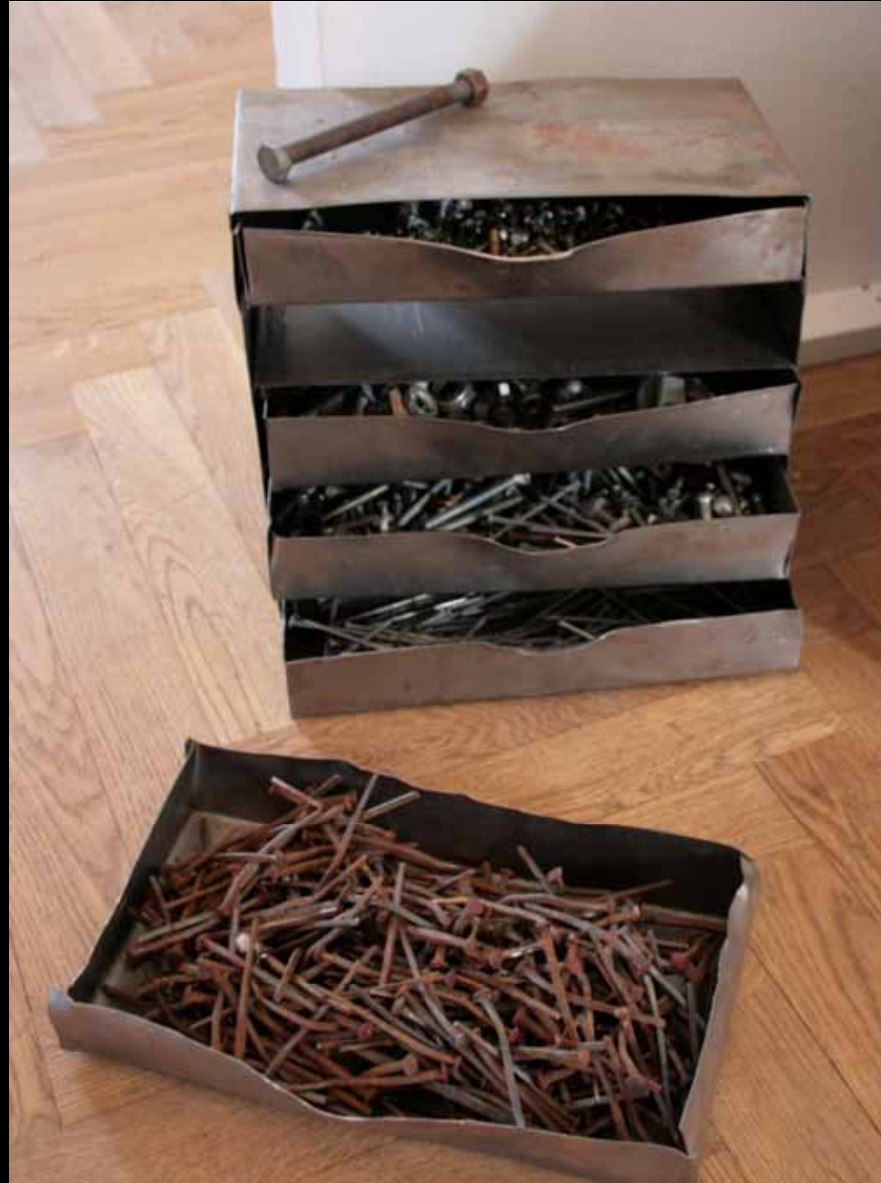
Utställningen "Udda samlingar och mera sansade". Tavelnsjö hembygdsförening april 2007.

”He kan va bra [ ha om man behöv slö fast n´ bree”