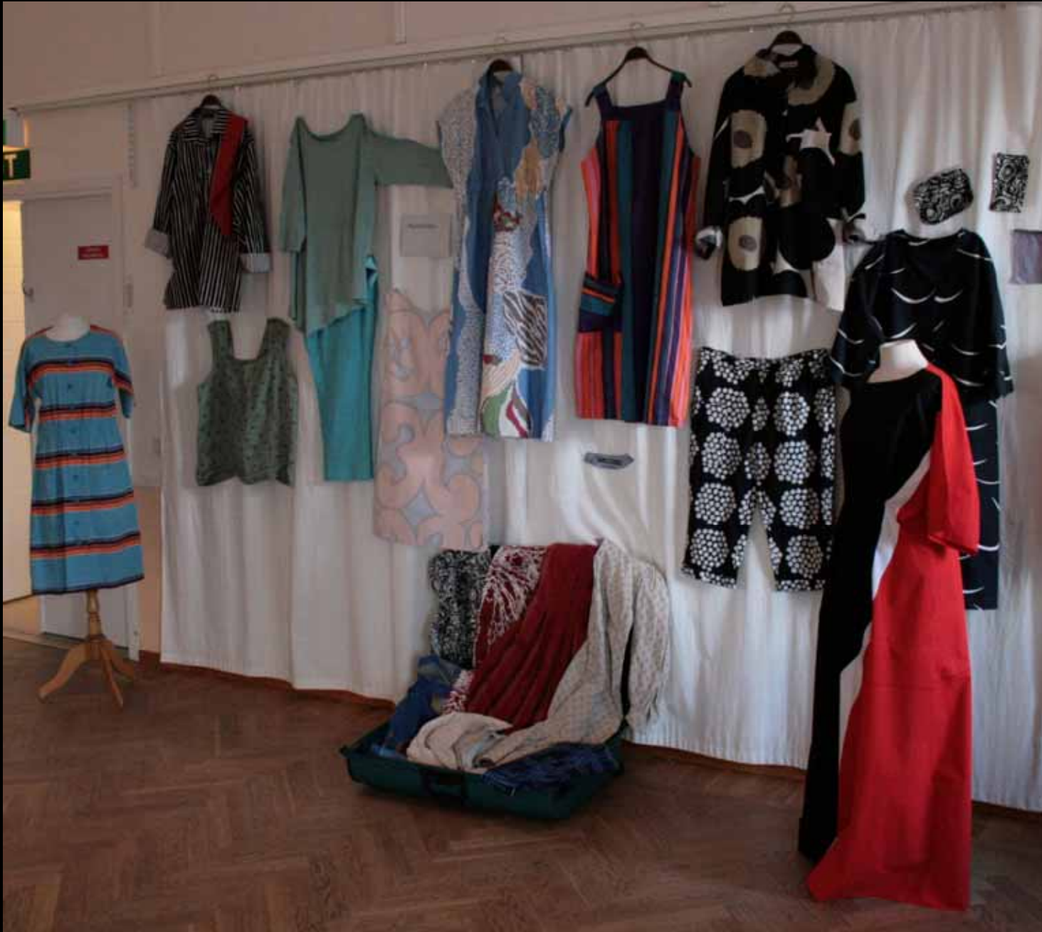
Utställningen "Udda samlingar och mera sansade". Tavelnsjö hembygdsförening april 2007.