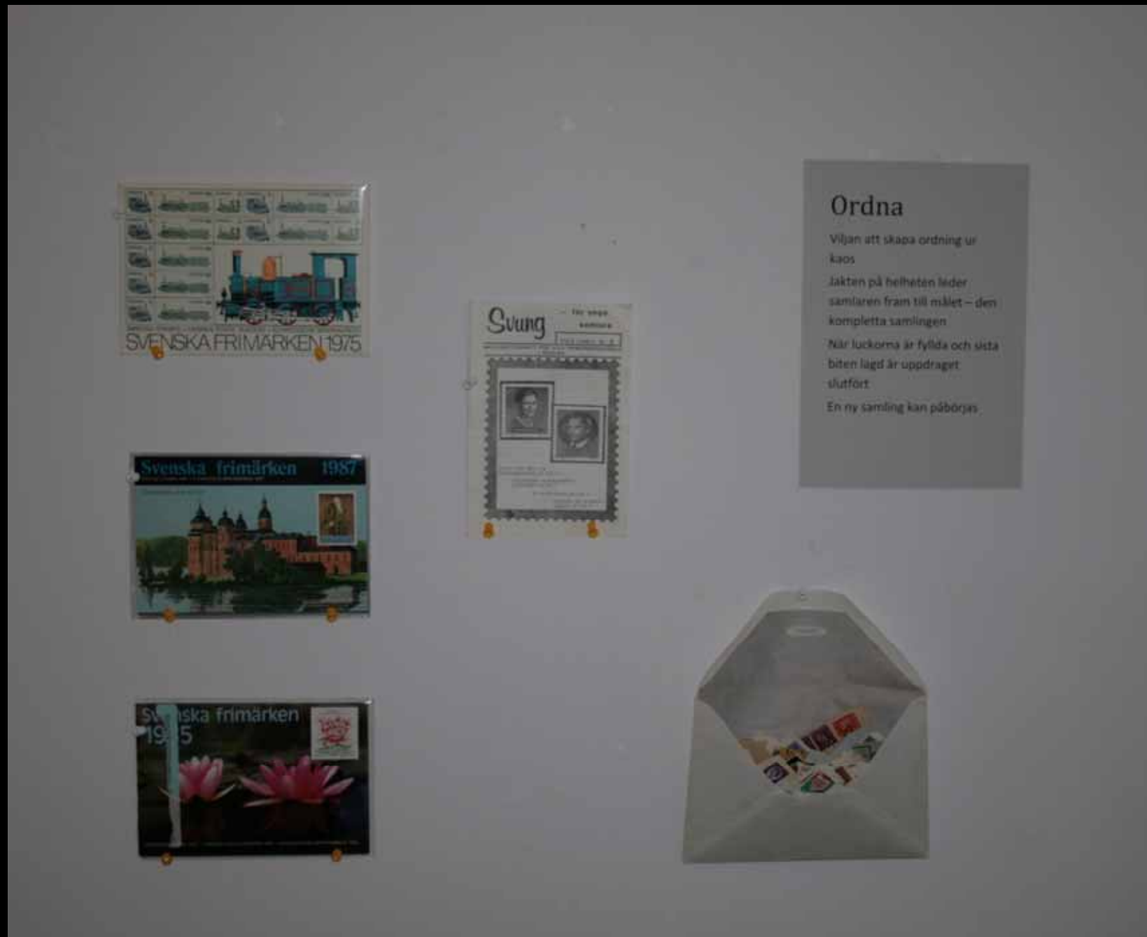
Utställningen "Udda samlingar och mera sansade". Taveljö hembygdsförening april 2007.