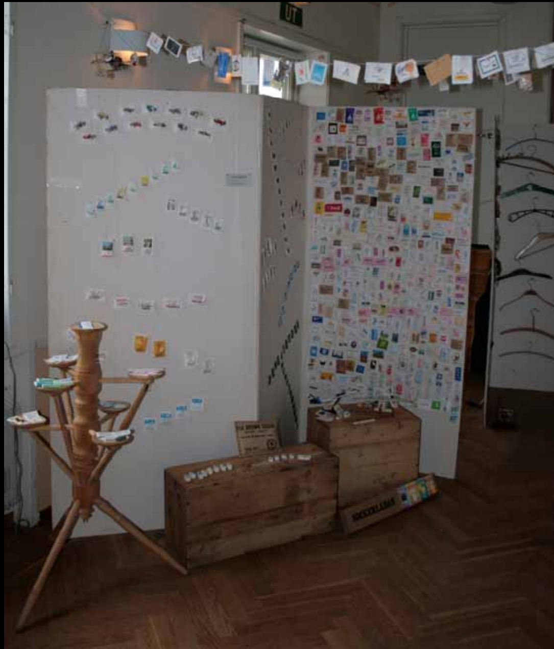
Utställningen "Udda samlingar och mera sansade". Tavelnsjö hembygdsförening april 2007.