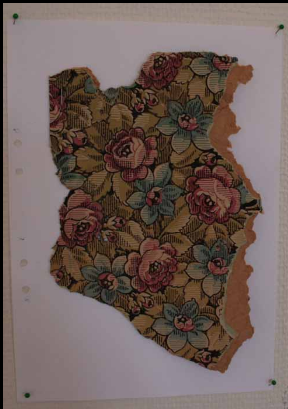
Utställningen "Udda samlingar och mera sansade". Taveljö hembygdsförening april 2007.