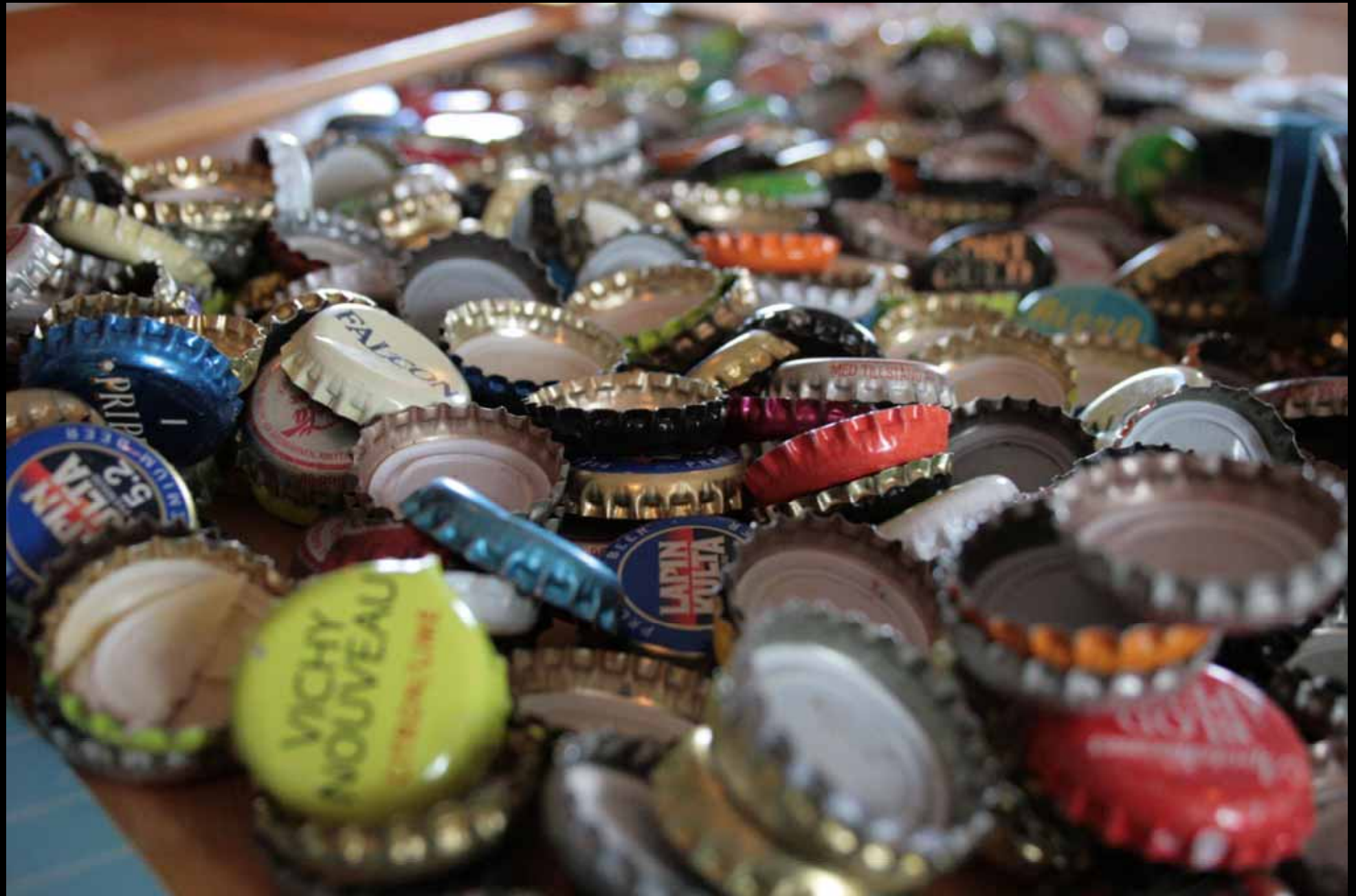
Utställningen "Udda samlingar och mera sansade". Tavelsjö hembygdsförening april 2007.