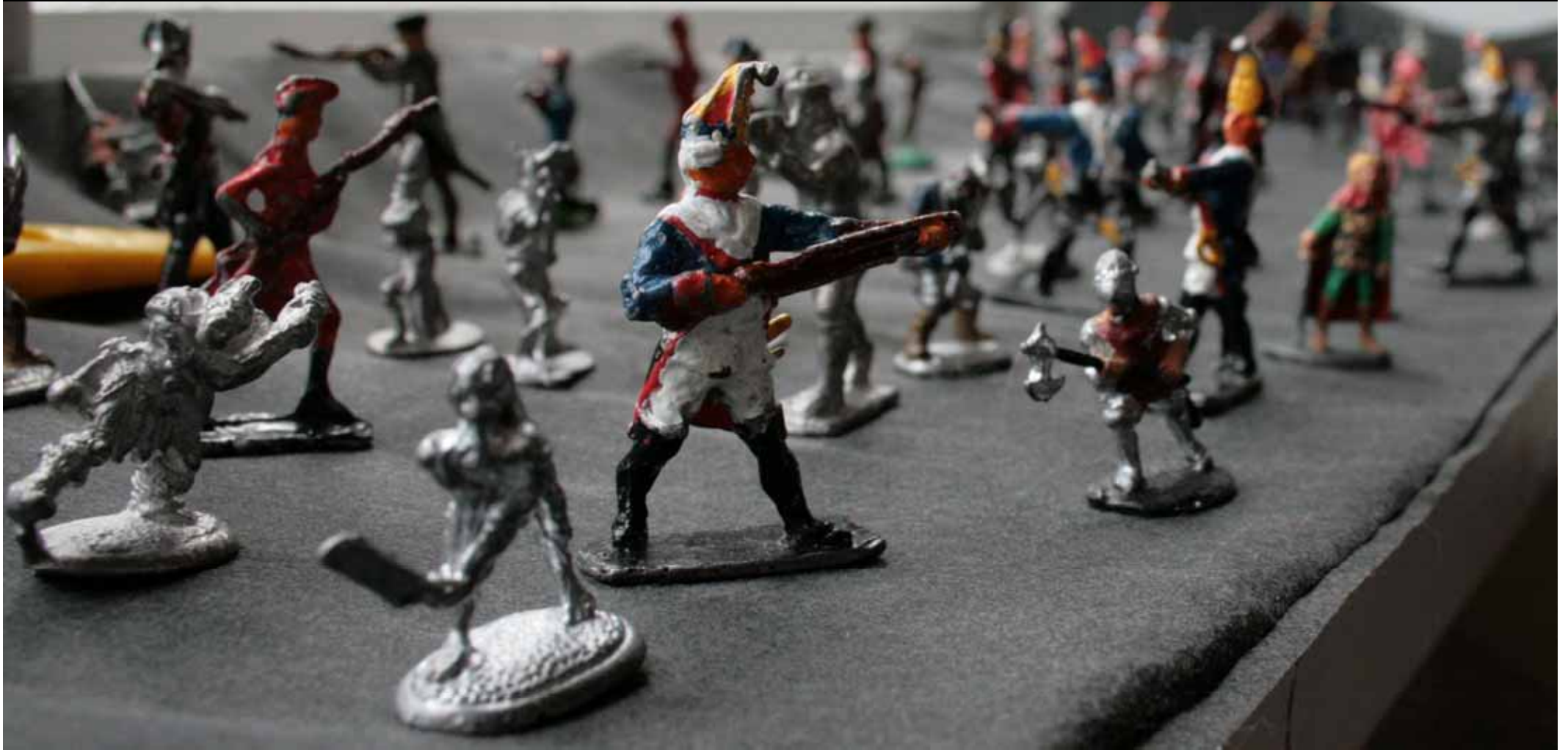
Utställningen "Udda samlingar och mera sansade". Taveljö hembygdsförening april 2007.