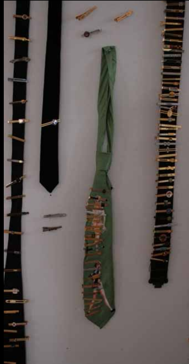
Utställningen "Udda samlingar och mera sansade". Tavelnsjö hembygdsförening april 2007.