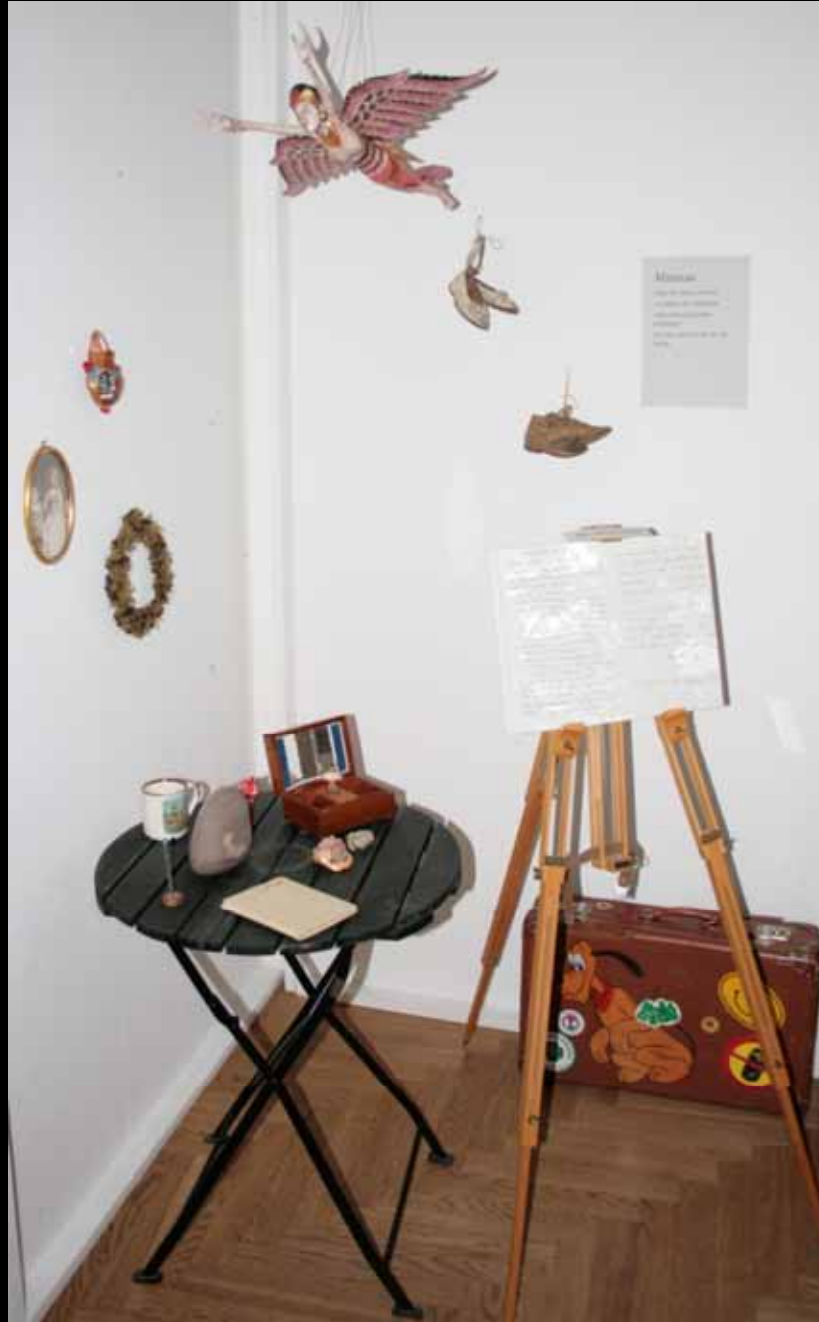
Utställningen "Udda samlingar och mera sansade". Tavelsjö hembygdsförening april 2007.