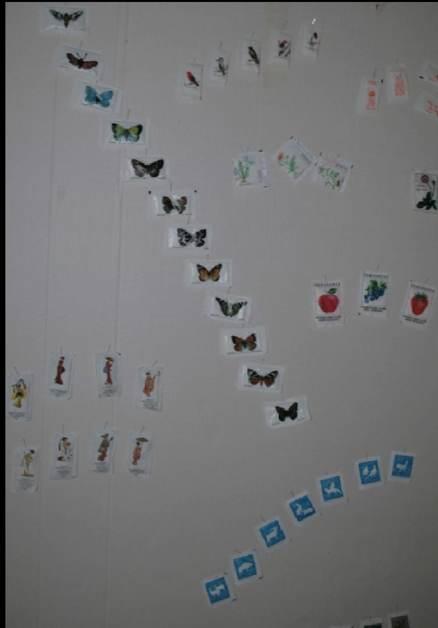
Utställningen "Udda samlingar och mera sansade". Tavelnsjö hembygdskommitté april 2007.