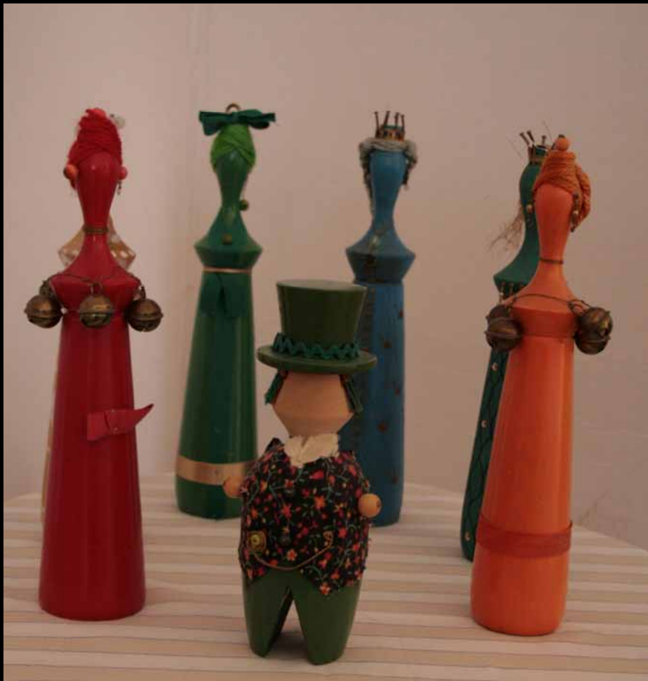
Utställningen "Udda samlingar och mera sansade". Taveljö hembygdsförening april 2007.