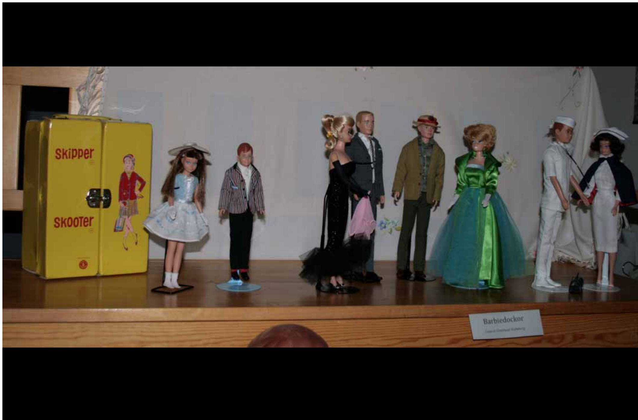
Utställningen "Udda samlingar och mera sansade". Tavelnsjö hembygdsförening april 2007.