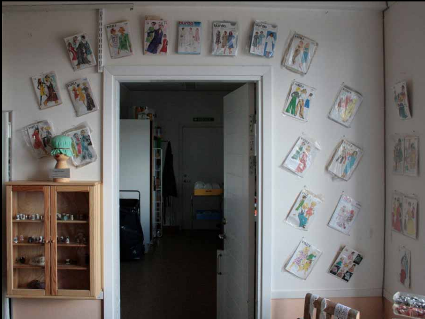
Utställningen "Udda samlingar och mera sansade". Taveljö hembygdsförening april 2007.