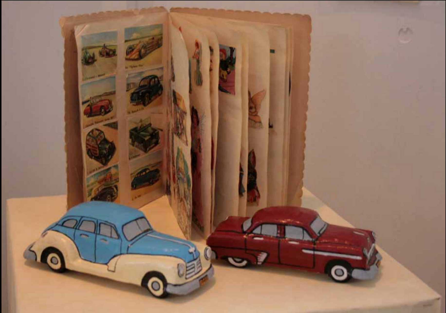
Utställningen "Udda samlingar och mera sansade". Taveljö hembygdsförening april 2007.