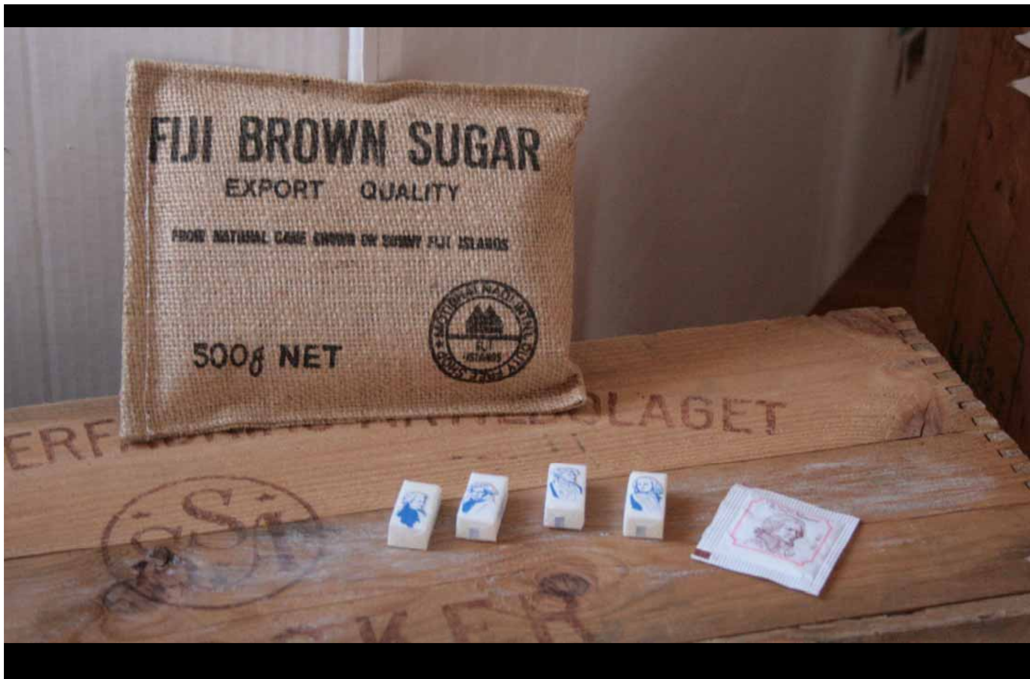
Utställningen "Udda samlingar och mera sansade". Taveljö hembygdsförening april 2007.