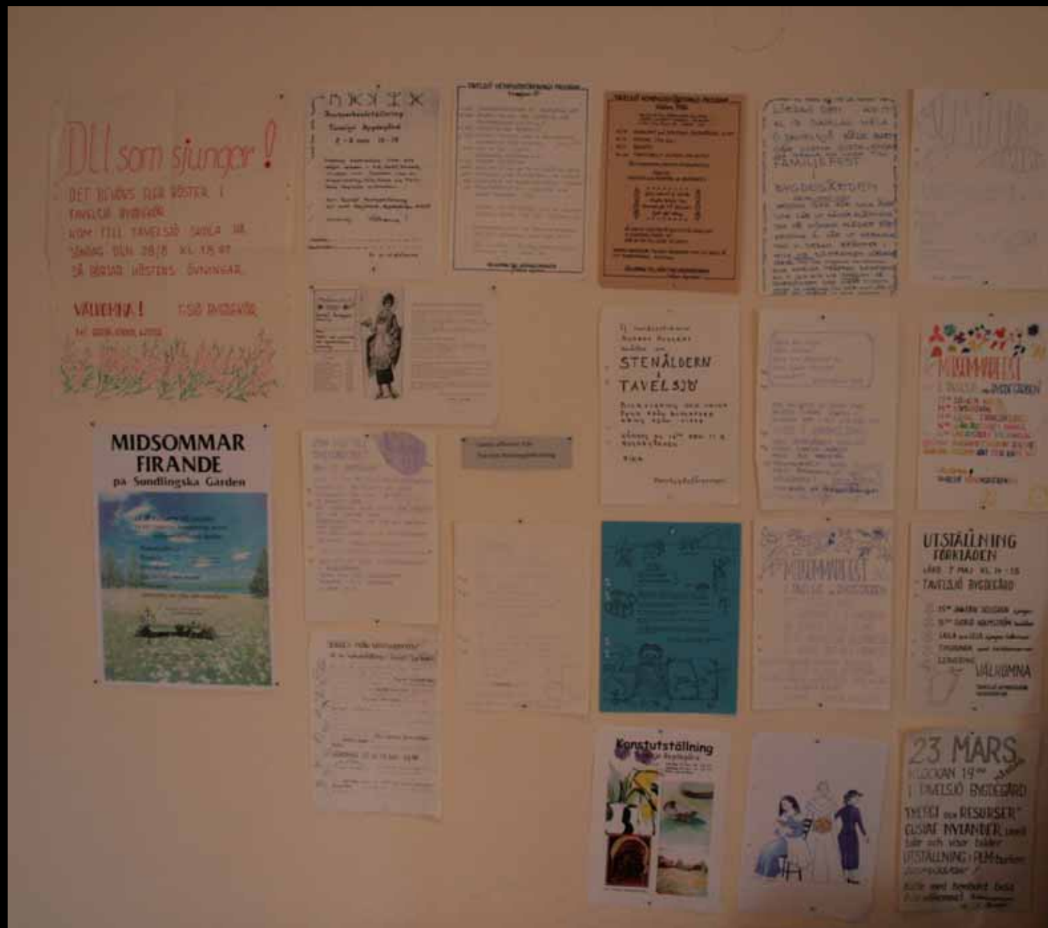
Utställningen "Udda samlingar och mera sansade". Tavelssjö hembygdsgörelse april 2007.