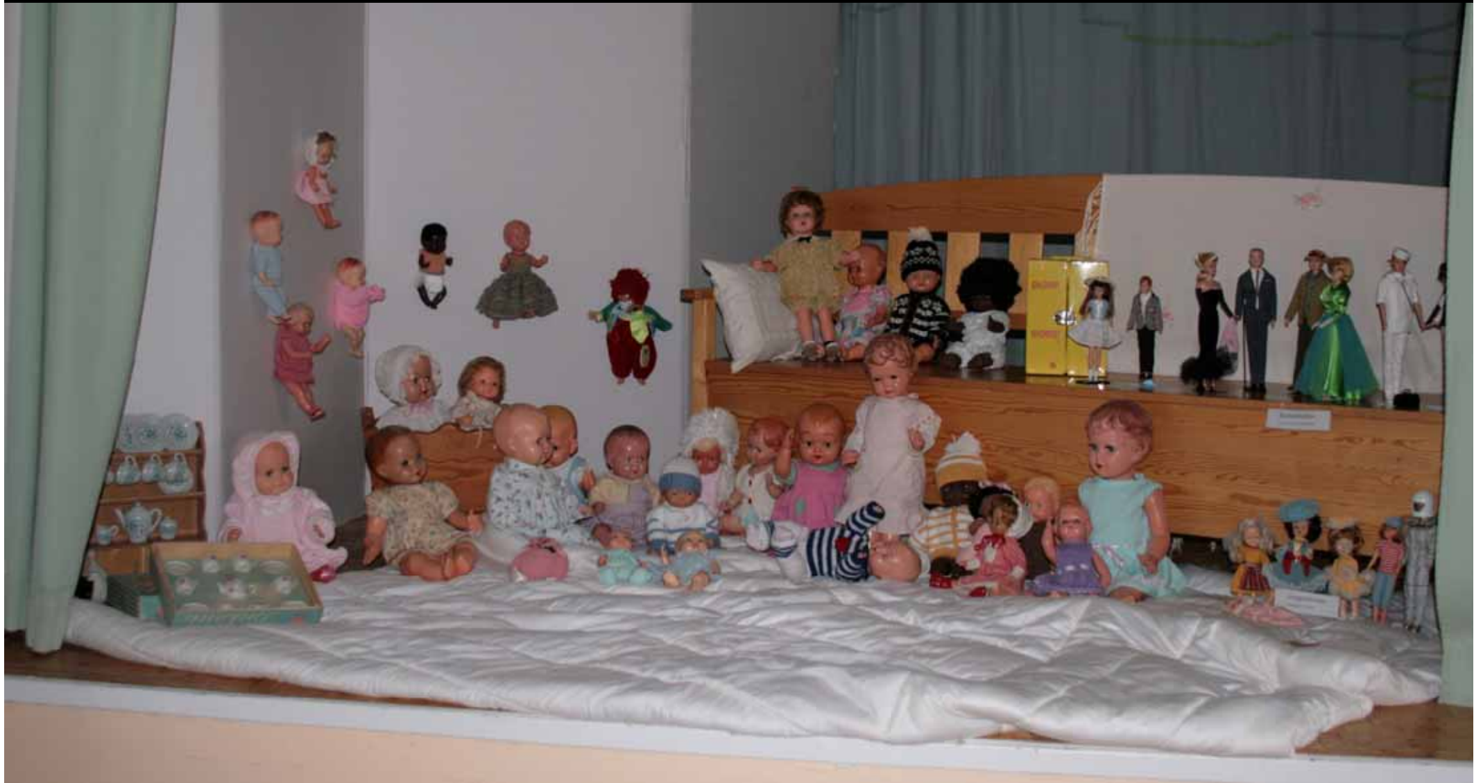
Utställningen "Udda samlingar och mera sansade". Taveljö hembygdsförening april 2007.