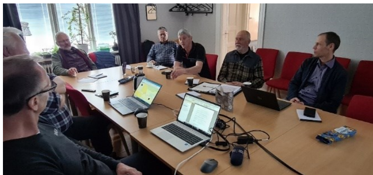
Planeringsmöte inför byggsäsongen 2023.

Utöver allmän information och till exempel kallelser till möten kan