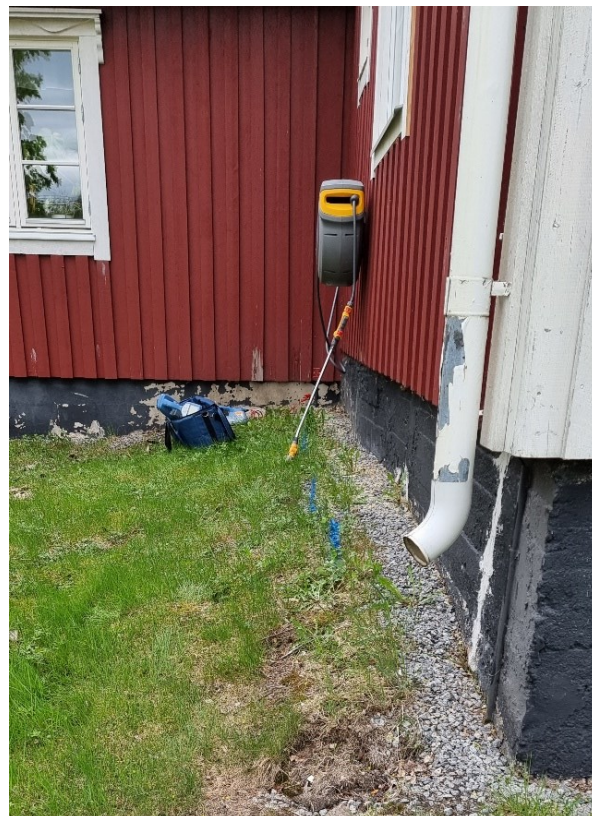
Det är viktigt att begära utsättning innan man gräver.

Överlåtelse av medlemskap när en fastighet säljs hanteras via medlemsservice.