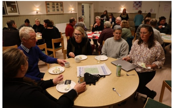
Rödåsel 26 september