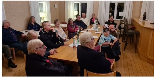
Norrby 27 september