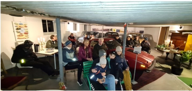
Gullsjö 11 oktober