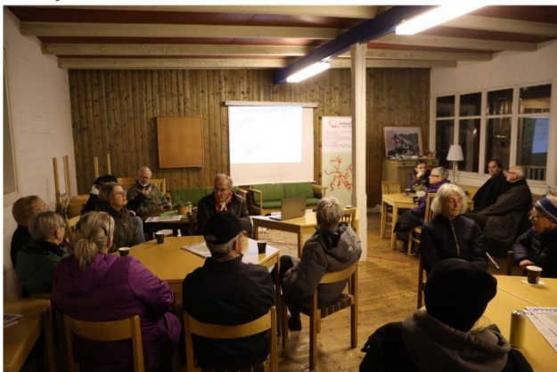
Haddingen (Lyckebo) 18 oktober