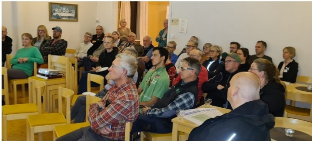
Varmvattnet 17 oktober