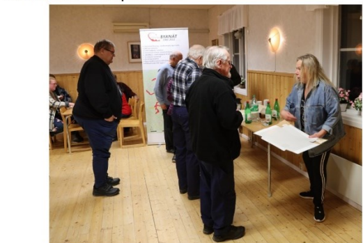
Mickelträsk 15 oktober