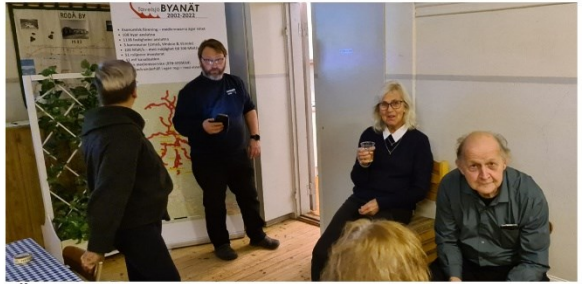
Överrödå 13 oktober