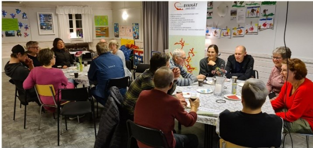
Vindeln-Ånäset 6 oktober