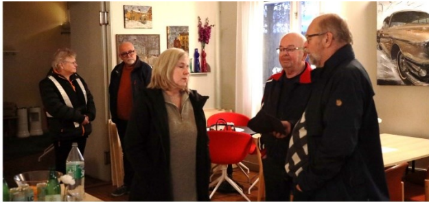
Stärkesmark 3 oktober