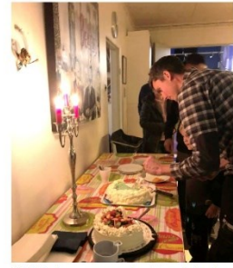
Stärkesmark 3 oktober