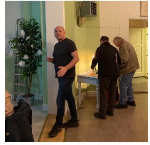
Selet 28 september